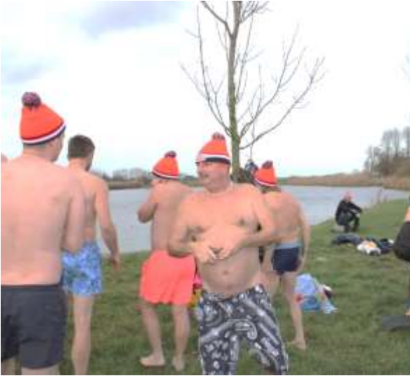
En zchte helden.....