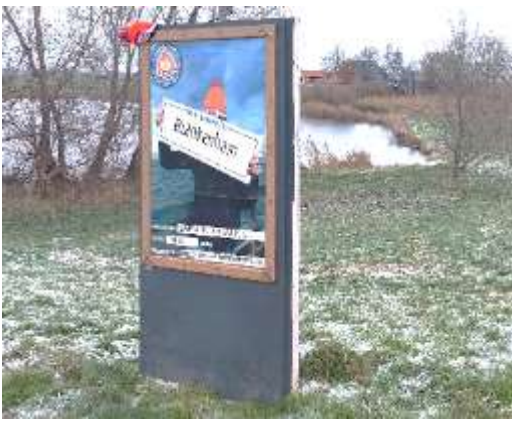
Nieuwjaars duik in de kolk van Blankenham.