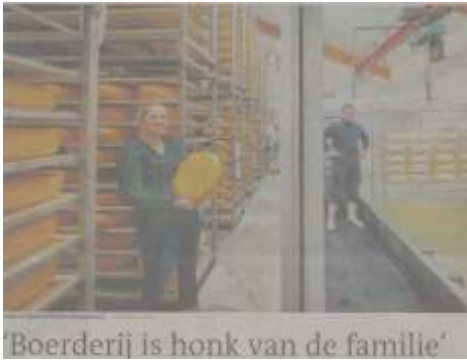
'Boerderij is honk van de familie'