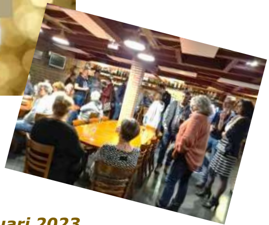
Nieuwjaarsborrel 20 januari 2023.