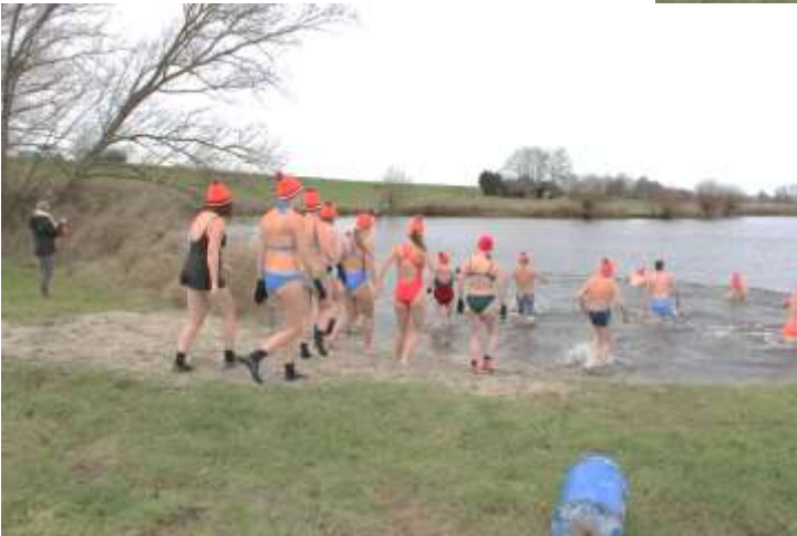
Het water was wel erg koud 9 graden.