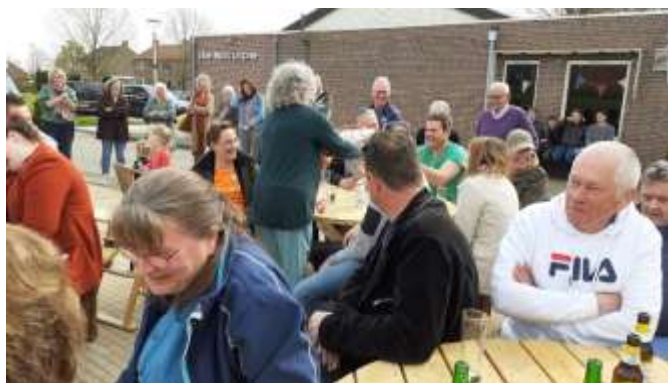
In spanning afwachten.....