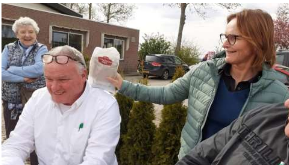
Poedelprijs team Gerards.