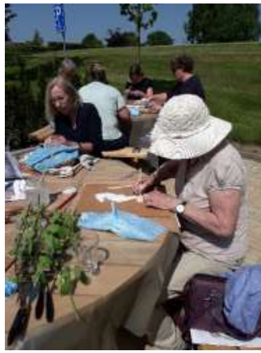
Hèrlijk wèr op ons nìeuwè tèrras.