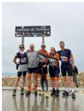
Team Blankenham 2023 Team plus begeleiding Blankenham 2023