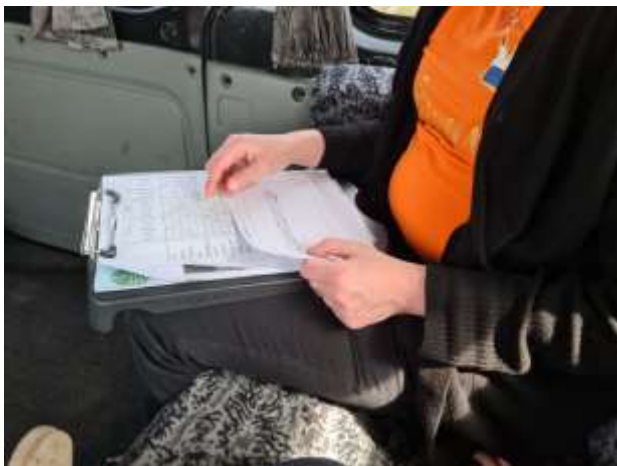
De uitslag zen heel gepuzzel.