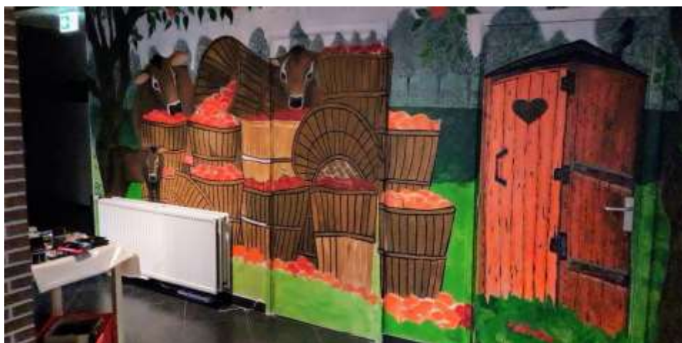
De muurschildering in de ontmoetingsruimte van het dorpshuis vordert gestaag.

Precies HONDERD JAAR geleden telde ons land 7,2 MILJOEN inwoners (nu bijna 18 MILJOEN ). Het gemiddelde maandinkomen bedroeg € 86,67 . De populairste meisjesnamen waren niet Julia, Olivia en Mila, maar Maria, Johanna en Anna. En voor jongens niet Noah, Luca en Lucas, maar Johannes, Jan en Cornelis. Ons land was echt een stuk armer dan tegenwoordig en de crisistijd moest nog beginnen. Ofschoon de lonen laag waren, kon je voor € 1 (alles van gulden omgerekend) het volgende kopen: 1 kg aardappelen, 1 brood, 10 eieren, 1 liter melk, 1 kg suiker en een pakje thee. Nu betaalt u daar minstens € 9,50 voor dus TIEN KEER zoveel. De meeste mensen gingen in 1924 trouw naar de kerk. Slechts 8 PROCENT noemde zich onkerkelijk. Nu is dat 57 PROCENT . Er waren circa 30.000 Personenauto's (nu richting 10 miljoen), maar we hadden een eeuw geleden wel meer spoorlijnen. Rond deze tijd in 1924 werden zanger Jules de Corte, acteur Marlon Brando en actrice en zangeres Doris Day geboren.